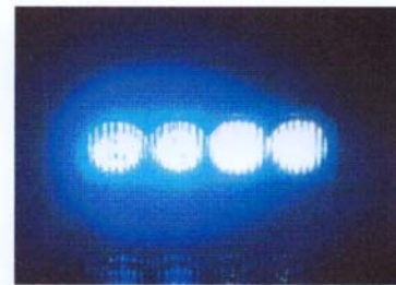
(ブルー LED×2 ホワイト LED×2)