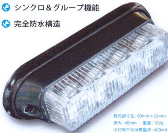
発光部寸法 : 90mm × 25mm 厚み : 40mm 重量 : 162g 点灯時平均消費電流 : 400mA